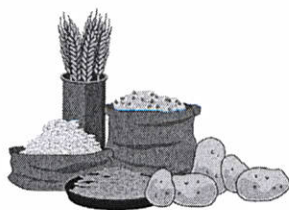
Cereales y leguminosas