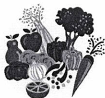
Frutas y Verduras

A continuación se muestra la información necesaria y las características principales que deberán cumplirse para el abastecimiento de los insumos, almacenamiento, transporte y entrega.